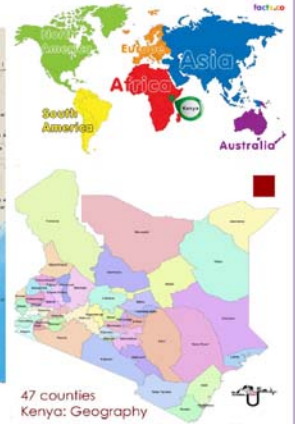
47 counties Kenya: Geography